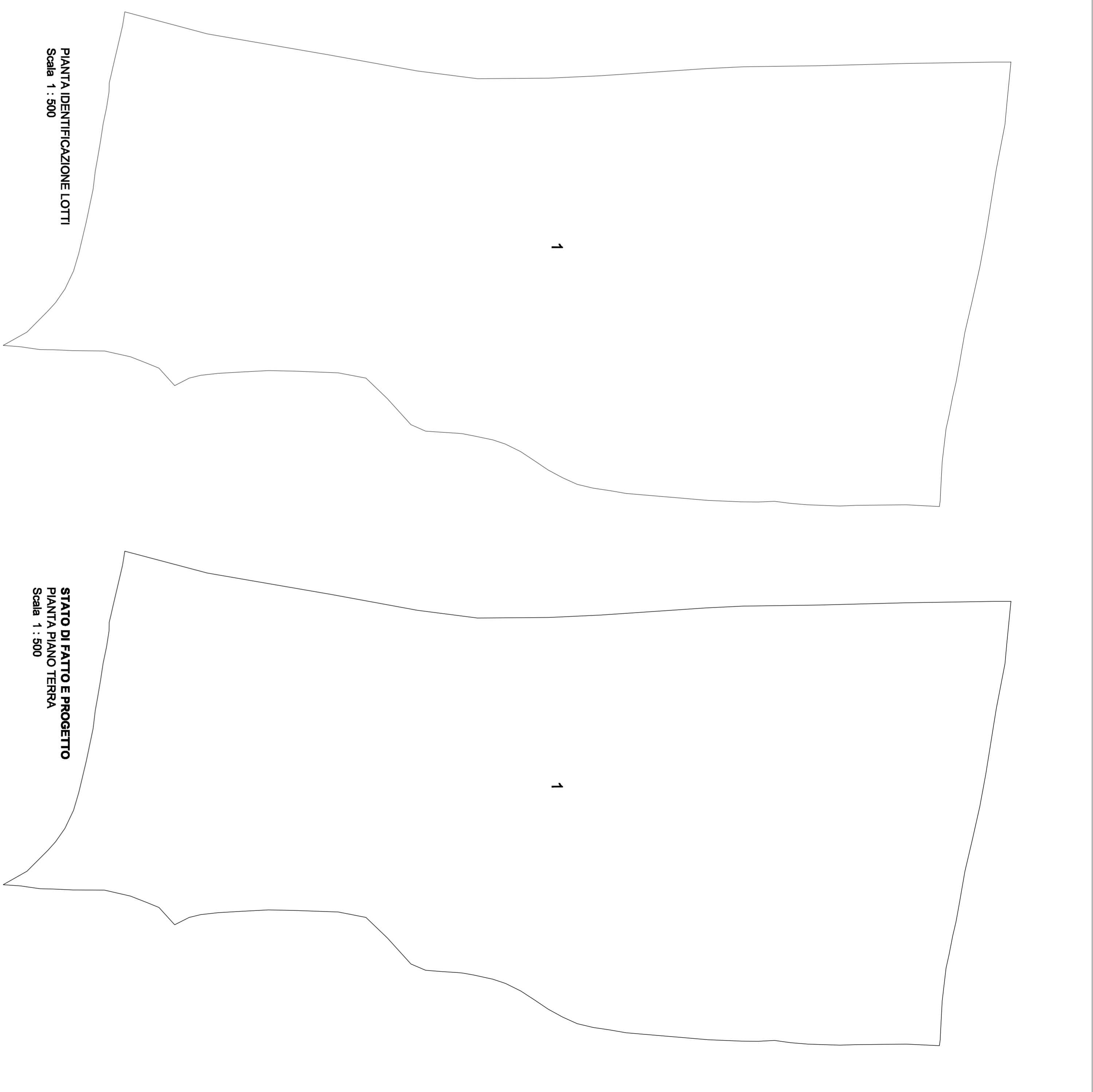
PIANTA IDENTIFICAZIONE LOTTI Scala 1 : 500 PIANTA FATTO E PROGETTO PIANTA PIANO TERRA Scala 1 : 500