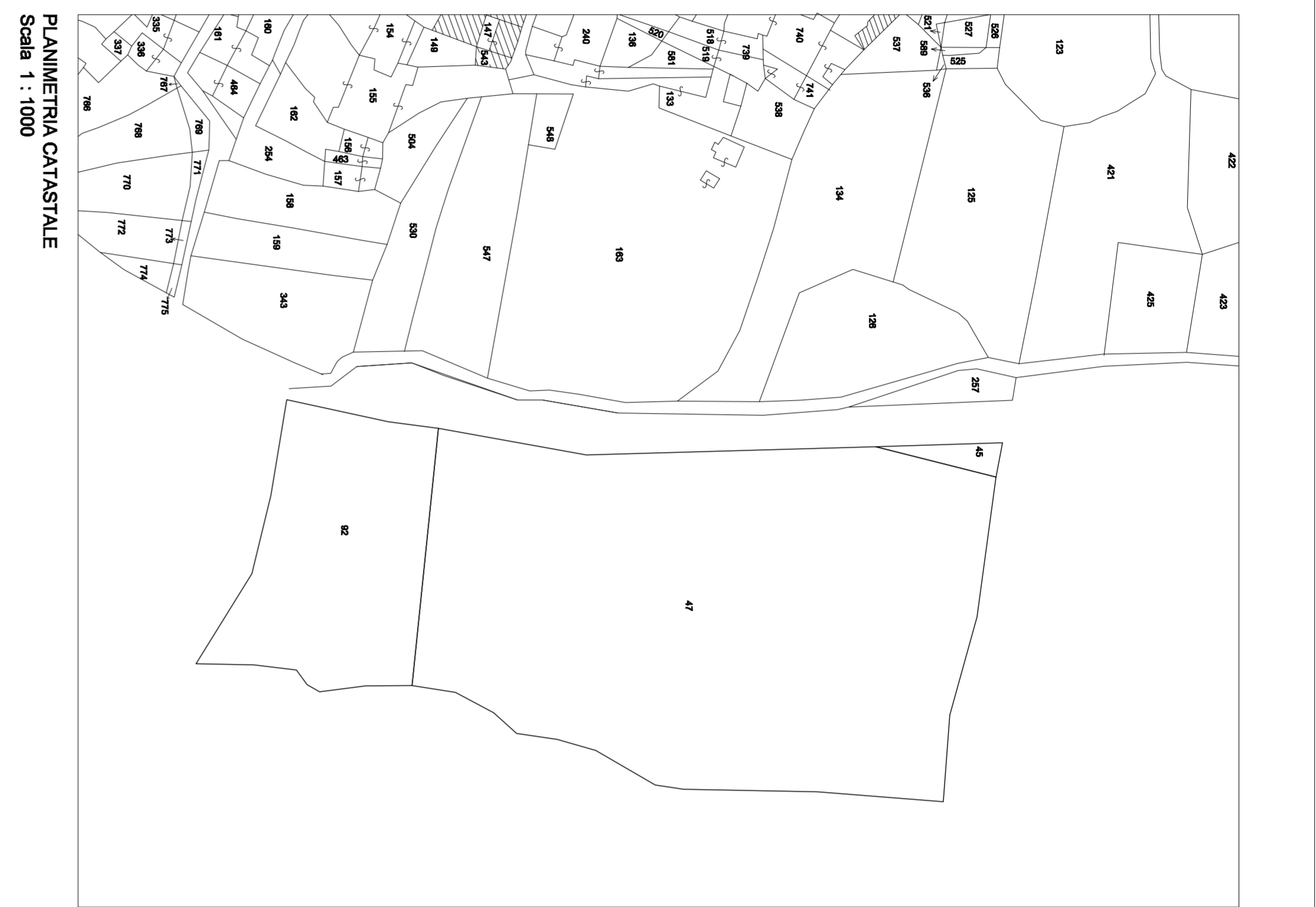
PLANIMETRIA CATASTALE Scala 1 : 1000

ISOLATO 31 OGGETTO: PLANIMETRIE PROFILI REGOLATORI SCALA: 1 : 500; 1 : 1000 ELABORATO: 6.31 DATA: OTTOBRE 2005 AGGIORNAMENTO: PROGETTISTA: Arch. Gianfranco Sama COLLABORATORI: Giovanni Currelli Ing. Loredana Carta Arch. Moreno S. Castellano Geom. Vincenzo Olla IL SINDACO: Dot. Salvatore Sdi IL RESPONSABILE DEL PROCEDIMENTO: Geom. Sergio Incani