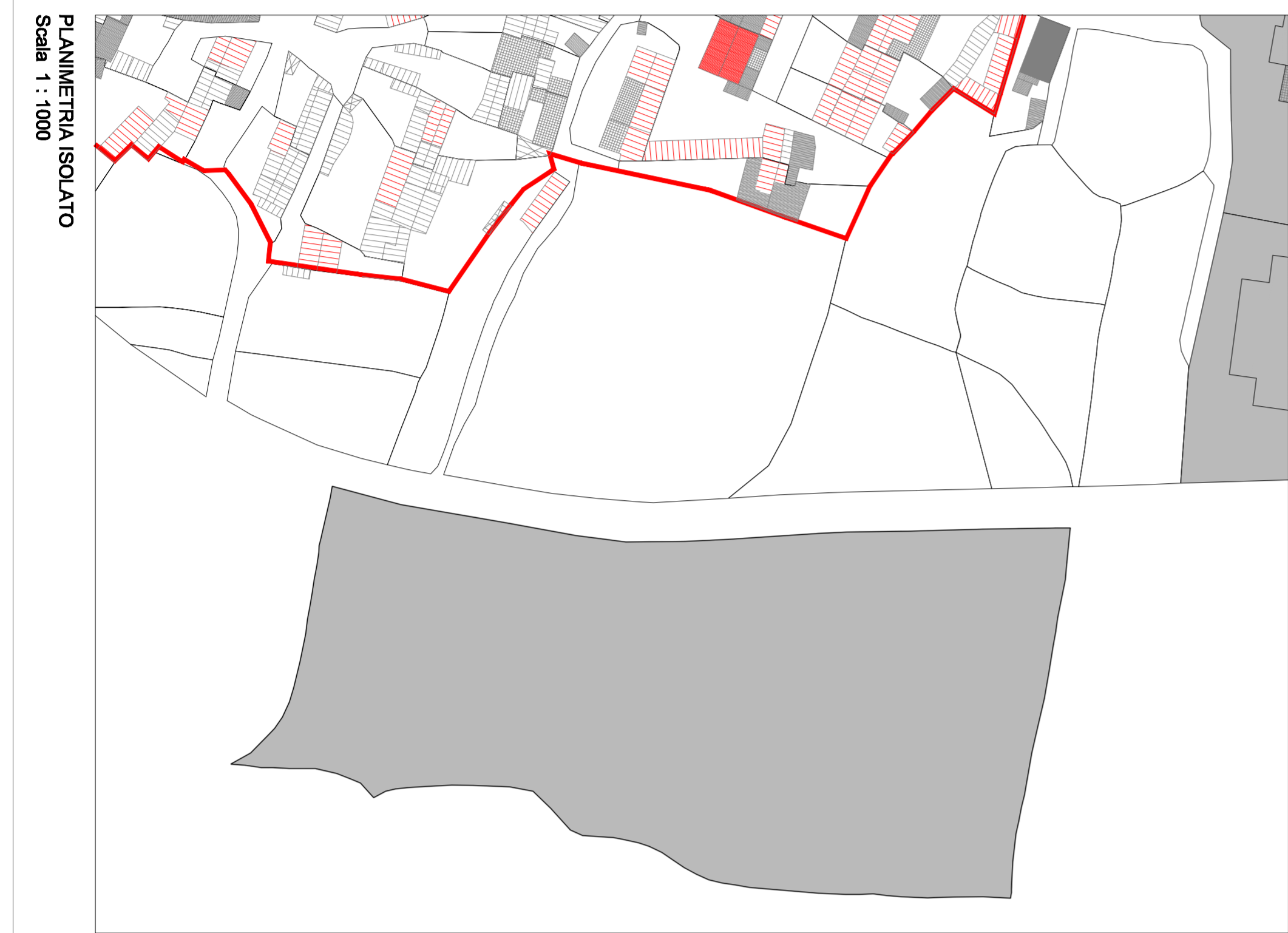
PLANIMETRIA ISOLATO Scala 1 : 1000